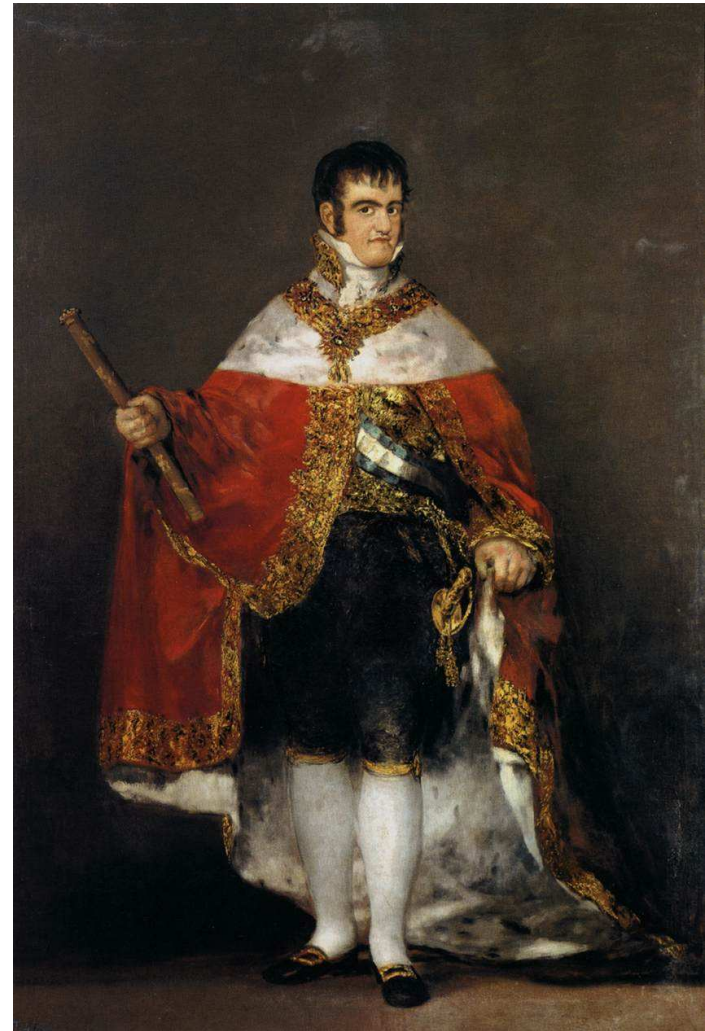
Fernando VII pintado por Goya en 1814