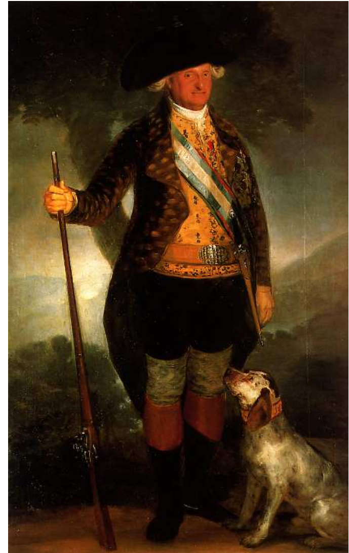
Carlos IV pintado por Goya 1789