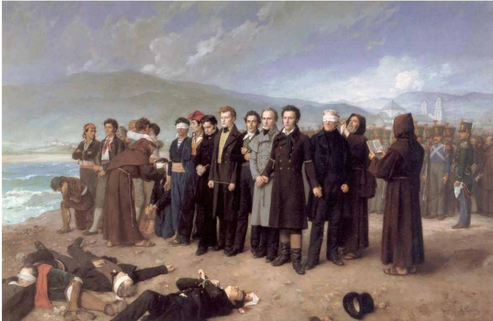
Fusilamiento de Torrijos y sus compañeros