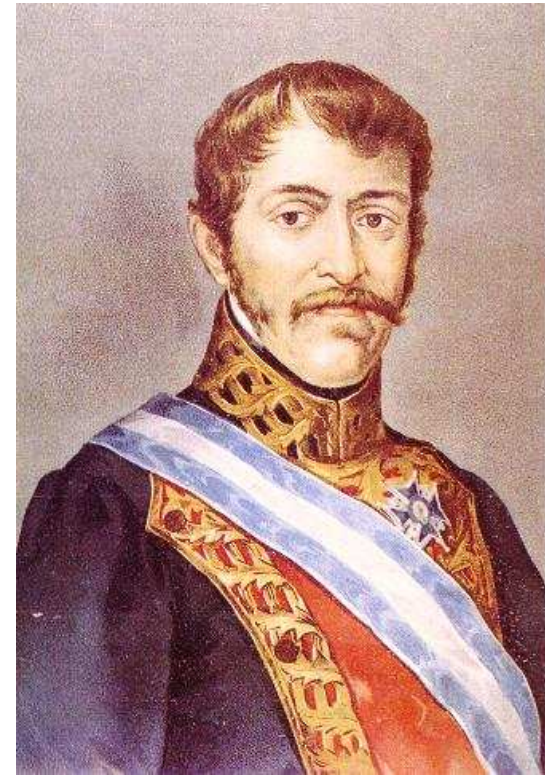
Carlos María Isidro