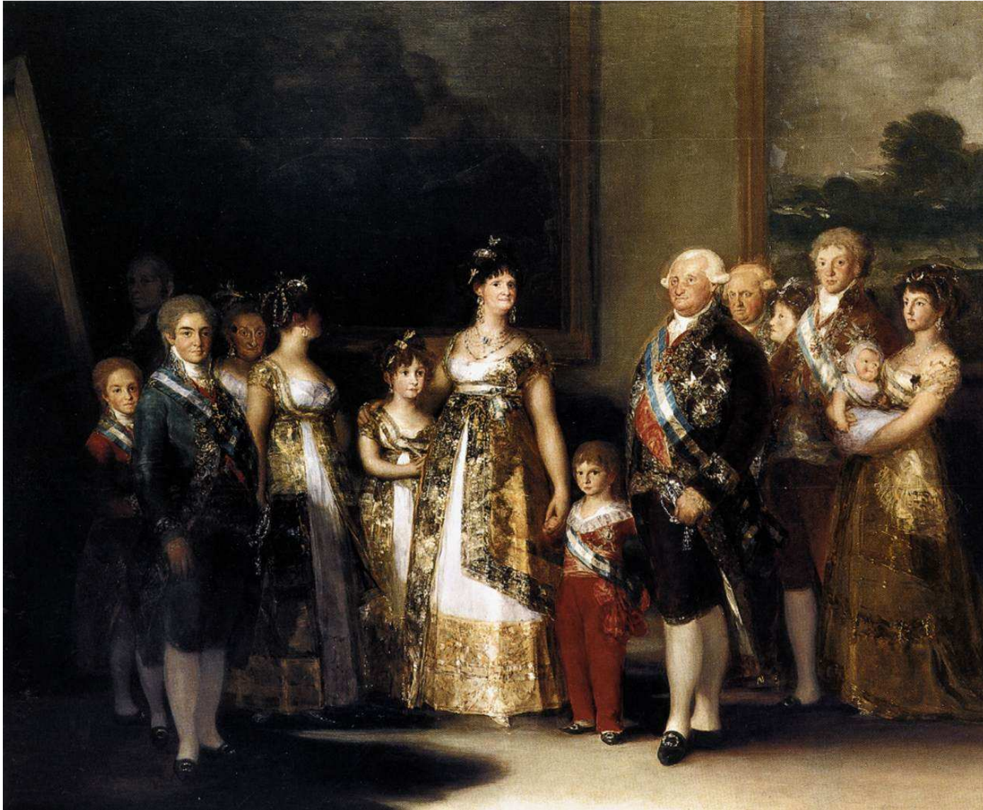
Familia de Carlos IV. Goya. 1800