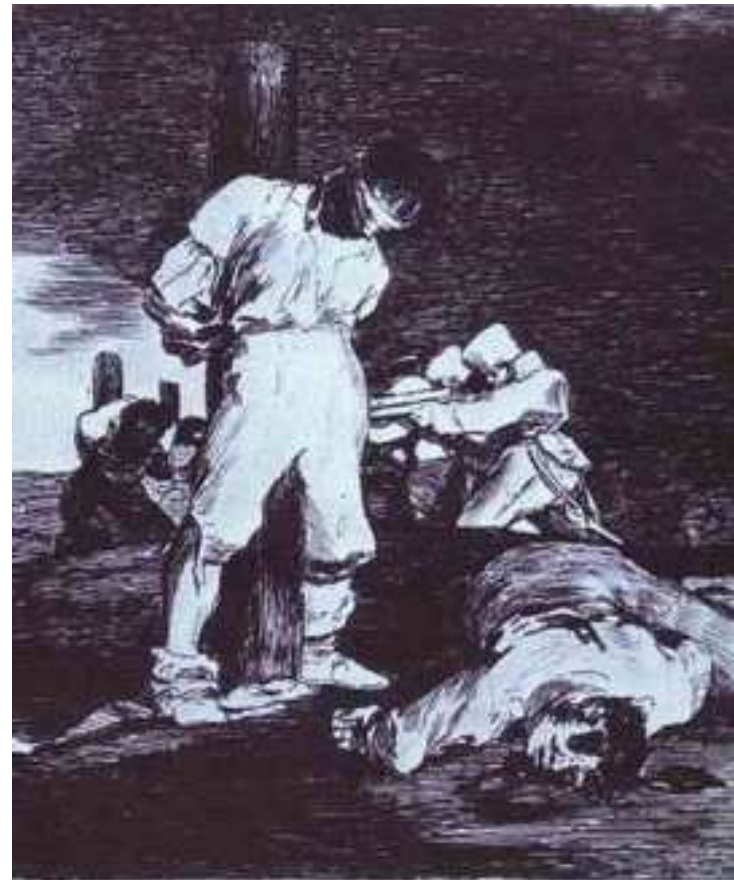
Los desastres de la guerra. Grabado de Goya