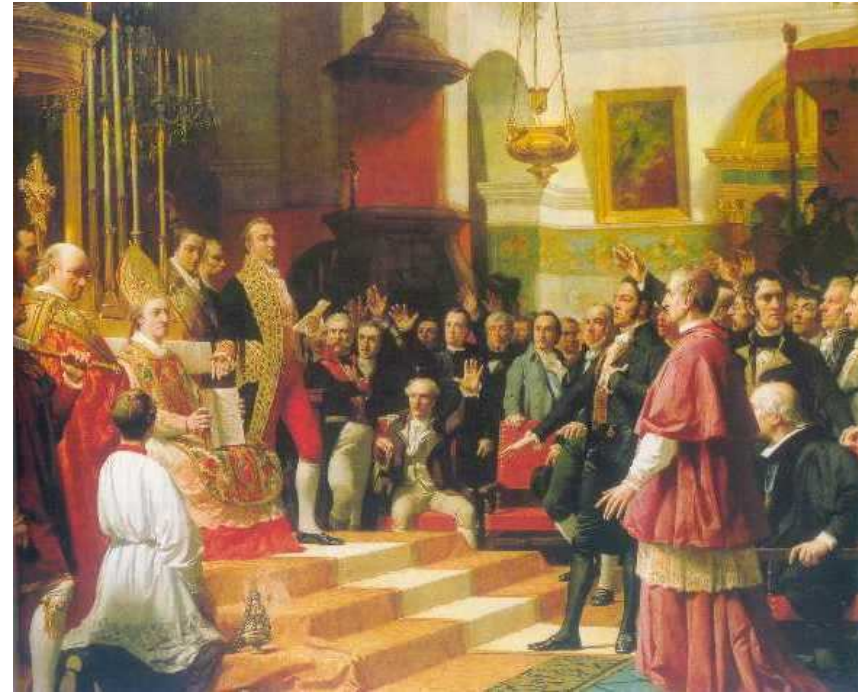
Juramento de los Diputados a las Cortes de Cádiz