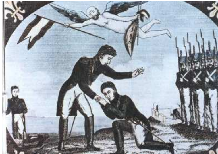
El duque de Angulema saludando a Fernando VII