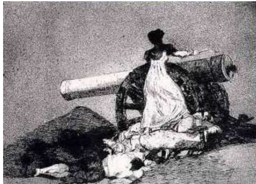
Los desastres de la guerra. Grabado de Goya