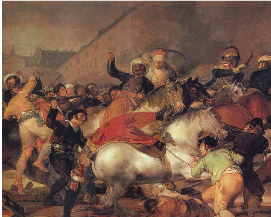
Dos de mayo de 1808 Goya