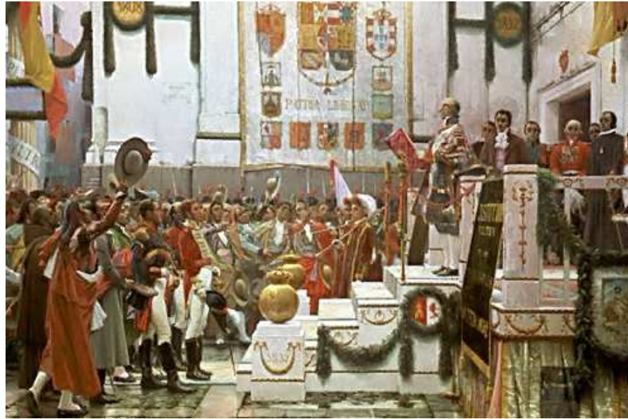
Proclamación de la Constitución de Cádiz