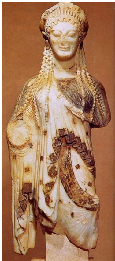
IMATGE 3 / IMAGEN 3