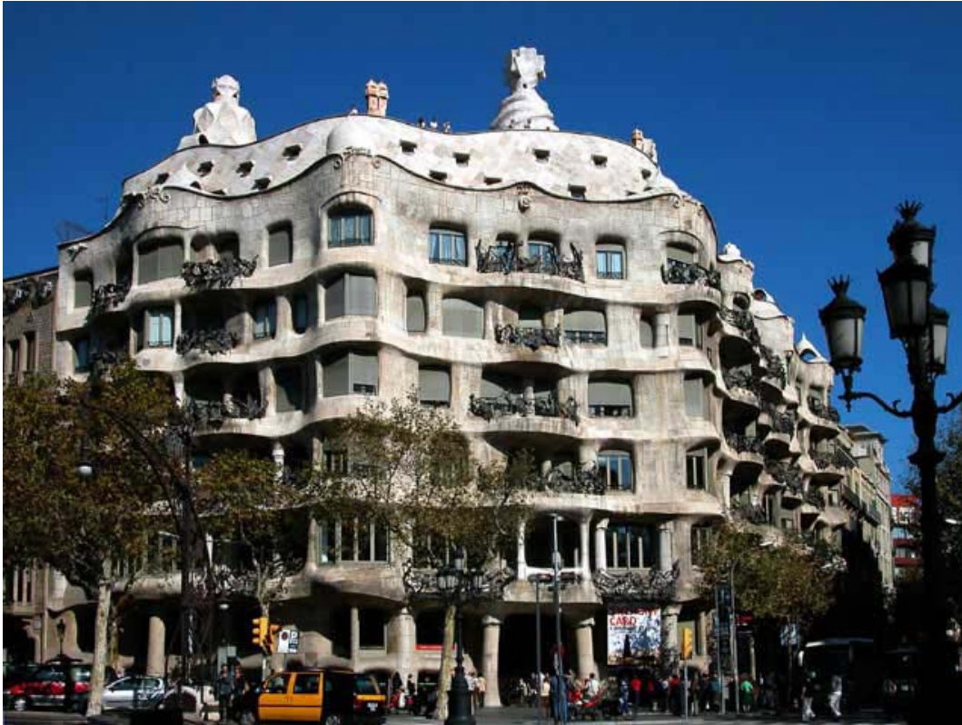
IMATGE 1 / IMAGEN 1

Casa Milà, Antoni Gaudí. Barcelona. 1906-1912.