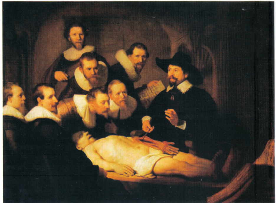
Imagen 2. La lección de anatomía del doctor Tulp. Rembrandt.1632.