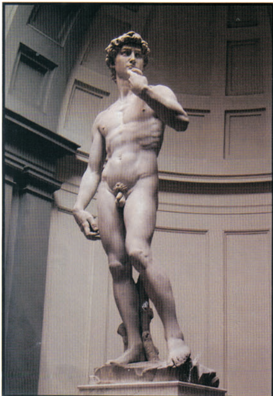
Imagen 1. David. Galeria de la Academia. Florencia. Miguel Ángel. 1501-1504.

Imatge 1. David. Galeria de l'Acadèmia. Florència. Miguel Ángel. 1501-1504.